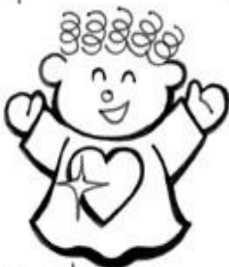
Los de Corazón Limpio