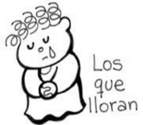
Los que lloran