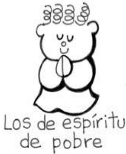
Los de espíritu de pobre