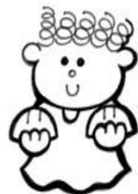
Los que aman la justicia